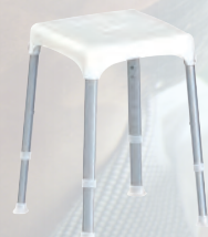
SGABELLO DA BAGNO regolabile