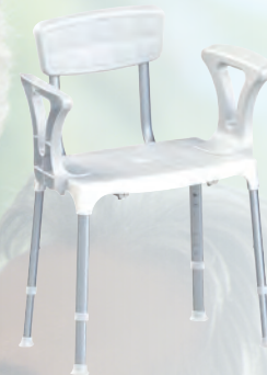
SEDIA DA DOCCIA con schienale e braccioli

Oltre 20 anni di esperienza nella progettazione di ausili per il bagno ci hanno portato ad essere il produttore numero 1 di accessori con design italiano per il comfort e la sicurezza nel bagno!